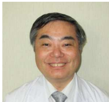
臨床教授・実習責任者