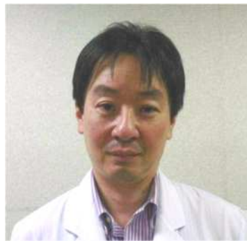
臨床教授・指導医