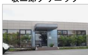
敬二郎クリニック