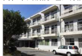
高松市民病院 塩江分院